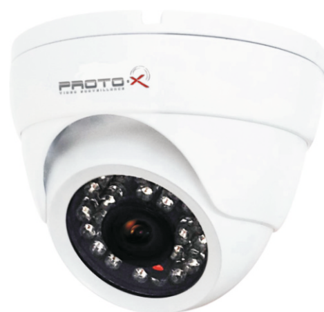
Антивандальная видекамера с ИК подсветкой